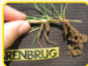
Obrázky ukazují schopnost výběžků RPR zakořenit